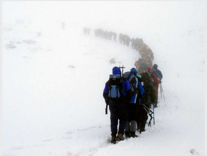
Izlazimo na vrh, Babin zub iza nas

Jutro nije obećavalo. Na završni uspon polazimo u nedelju u 7.00. Kolona se kreće polako, ne pravimo veliko rastojanje zbog magle. Pauze su kratke. Sve do vrha nas prati jak vetar sa snegom. Zanimljivo, niko se nije žalio, niti odustao od uspona. Korak po korak na vrh Ljubotena (2499m) izlazimo oko 10.30. Nekima je ovo repriza, jer su prethodnog dana stajali na istom mestu.