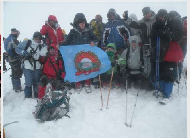
Vrh Ljuboten (2499m)

Zbog jako lošeg vremena ne zadržavamo se puno. Slikamo se i započinjemo sa spuštanjem. Kako smo se približavali domu magla je ostala iza nas. Sunce se pokazalo u par navrata, dovoljno da nam popravi raspoloženje.