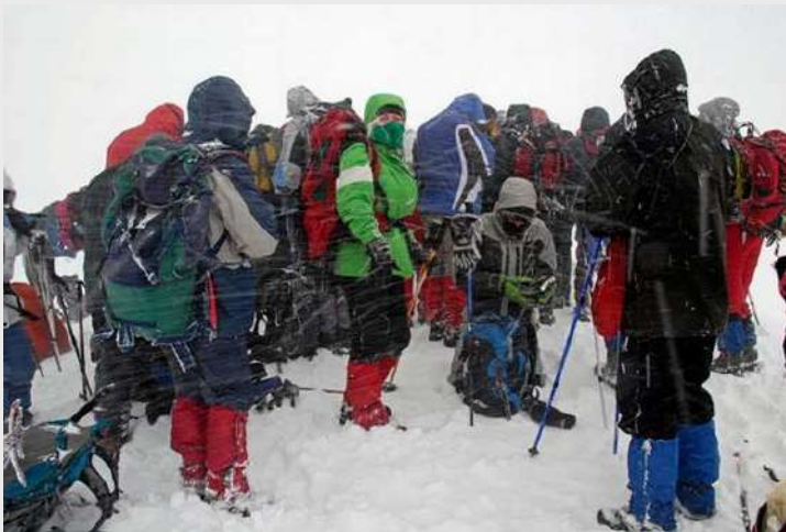
Vrh Ljuboten (2499m)