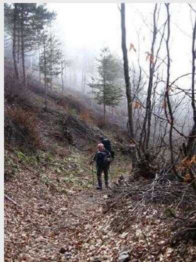
Prvi deo puta kroz šumu

Prvi deo puta je bez snega, ali kako smo povećavali visinu prvi susret sa snegom počinje na visini oko 1300 metara. Nakon 3h laganog pešačenja dolazimo do doma (1700m). Veći deo planinara se smešta u dom, ostali u bungalove i šatore. Dan je prelep, sunčan, tako da slobodno vreme provodimo ispred, grudvamo se, pravimo snešku. Nekoliko planinara koristi izvanredno vreme da pokuša da se popne na vrh, uspešno su to i ostvarili.